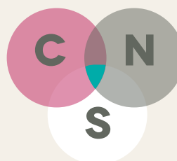
SCHÉMA D'UN ENGRAIS VERT ÉQUILIBRÉ

Un engrais vert équilibré se situe dans le patatoïde vert.